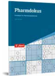
Julia Herzner: Pharmedokus – Formelquiz für Pharmaziestudierende.

PZ / Mit den Pharmedokus von Julia Herzner können Pharmaziestudierende auf spielerische Weise Strukturformeln, Summenformeln und Trivialnamen verinnerlichen. Die 36 Rätsel sind in »Organische Grundstrukturen« und »Arzneistoffe« eingeteilt und stammen aus allen Bereichen des Pharmaziestudiums. Jeder kennt die aus Japan stammenden Zahlenrätsel im Gitterformat. Doch statt Zahlen müssen in diesem Spiel Strukturformeln in die Kästchen platziert werden – und zwar so, dass sie in Spalte und Zeile nicht doppelt vorkommen. Drei Schwierigkeitsgrade erwarten den Spieler: 4 x 4, 6 x 6 und 9 x 9 Quadrate. Die Pharmedokus sollen aber nicht nur unterhalten, sondern auch einen Lerneffekt erzielen. Durch das genaue Einprägen und das wiederholte Platzieren der Formeln werden diese verinnerlicht.