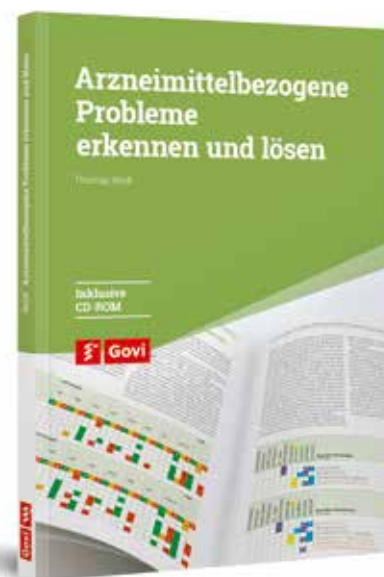
Thomas Riedl: Arzneimittelbezogene Probleme erkennen und lösen.

lungen illustriert und übersichtlich sortiert. Abgerundet wird das Werk durch Fallbeispiele (Kapitel 9) mit Anleitung zur Bewertung, Arbeitshilfen zur Medikationsanalyse und einer beiliegenden CD-ROM. Auf dieser befindet sich die tabellarische Darstellung aus dem Buch als Excel-Liste, mit der die Arzneistoffe einfach selektiert und synoptisch dargestellt werden können, was die Anwendung im Alltag erleichtern dürfte. Zusammengefasst ist das Buch ein erfrischend innovatives Werk eines offensichtlich vom Thema inspirierten Autors, das zu einem der Standardwerke im Bereich der dienstleistungs- und patientenorientierten Pharmazie der Zukunft werden dürfte. /