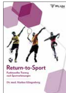
Markus Klingenberg: Return-to-Sport - Funktionelles Training nach Sportverletzungen

auszugleichen. »Bewegung und Training müssen genauso gewissenhaft verordnet werden, wie es bei Medikamenten gefordert ist«, so Klingenberg. Das Buch ist lesenswert für verletzte Sportler auf dem Weg zurück ins Training, ihre Betreuer und medizinisches Fachpublikum. /