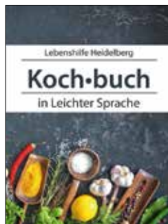
Steffen Schwab: Einfach Kochen in leichter Sprache.

Tierschutz, Bioanbau oder zum nachhaltigen Einkaufen. Je nach Ausprägung der Behinderung wird das nicht jeder direkt verstehen, ebenso wenig vermutlich wie das beschriebene Filetieren einer Orange. Das schmälert die Qualität des Buches, dessen Verkaufserlös der Lebenshilfe gespendet wird, aber überhaupt nicht. /