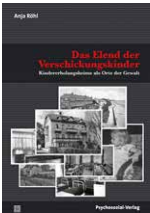
Anja Röhl: Das Elend der Verschickungskinder. Kindererholungsheime als Orte der Gewalt.

Auch heute noch erleben die Betroffenen nicht selten Unverständnis dafür, dass sechs Wochen einen so großen Einfluss auf das gesamte spätere Leben haben sollen. Durch die beiden Bücher, die einander sehr gut ergänzen, wird allerdings deutlich, dass die Kinderkuren ein Schlaglicht auf die gesamte Gesellschaft werfen und das Thema letztlich alle angeht. /