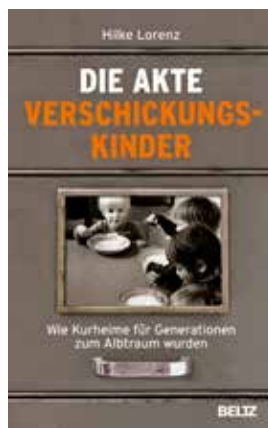
Hilke Lorenz: Die Akte Verschickungskinder. Wie Kurheime für Generationen zum Albtraum wurden.

Psychosozial-Verlag, 2021, kartoniert, 305 Seiten, ISBN: 978-3-8379-3053-5, EUR 29,90