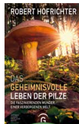
Robert Hofrichter: Das geheimnisvolle Leben der Pilze. Die faszinierenden Wunder einer verborgenen Welt.

– was ihm gelingt – mit überraschenden Informationen und zum Teil witzigen Details, dabei realistisch und wissenschaftlich basiert. /